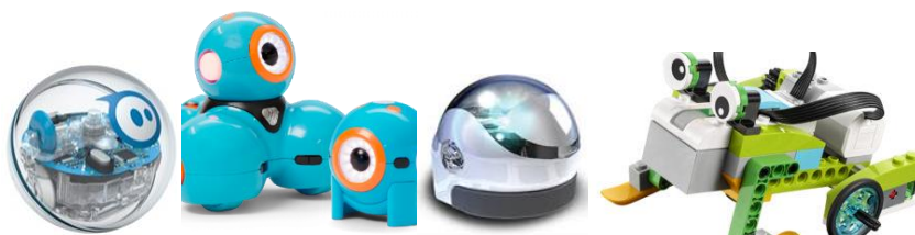
Ozobot, Sphero, Lego WeDo 2.0 och Dash & Dot

Du hittar dom på sliplay.se/mediecentervarmland